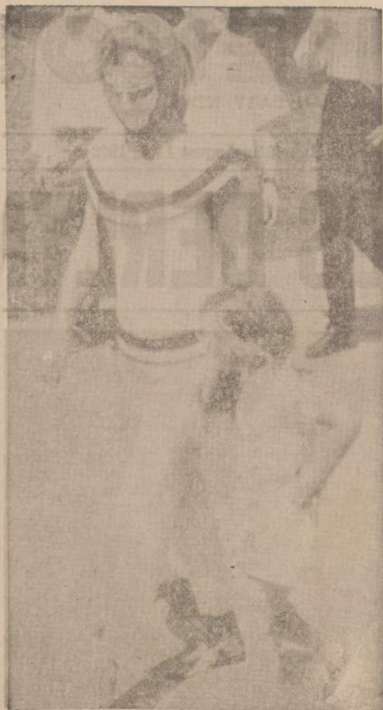
Jacqueline Kennedy ir jos dukrelė Caroline leidžia atostogas Italijos viloje, esančioje Ravello miestuke.