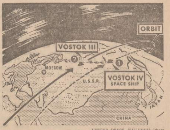
Sovietai paleido du erdvės laivus, kurie beveik toje pačioje orbitoje pradėjo sukurti aplink žemę. Erdvės laivai pavadinti Vostok III ir Vostok IV. Viename jų buvo kosmonautas Andrian Nikolajev, o antrame — Pavel Popovich.