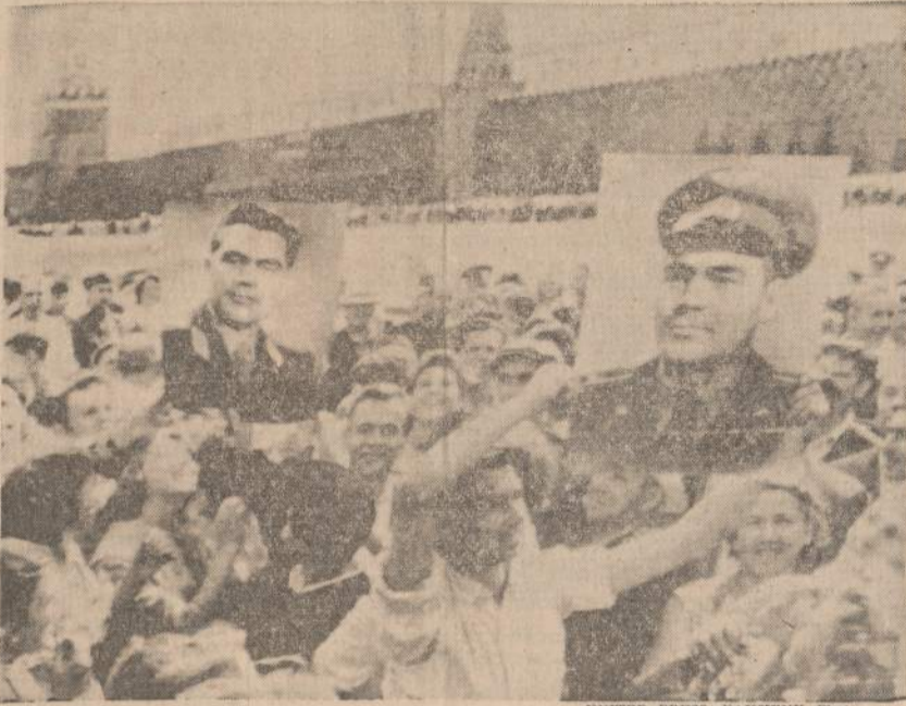
Maskvos gyventojai paraduoja Raudonąja Aikšte, nešdami didelius paveikslus naujojo kosmonauto, Andriano Nikolajevo.

• Olandų Naujosios Gvinėjos sostinėj Hollandijoje keletas šimtų vietinių gyventojų — papuarų suruošė demonstracijas, kodėl JT neduoda jiems nepriklausomybės, o perleidžia kitai sveitintai valstybei — Indonezijai.