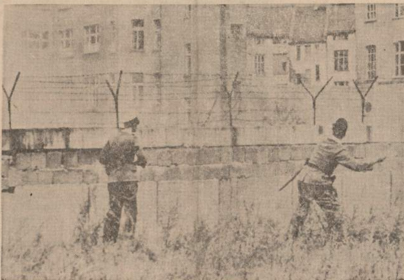
Vakarų Berlyno policininkas meta atgal iš anapus "gėdos sienos" komunistų numestą ašarinę bombą.

NSA (National Security Agency) yra tokia slapta ir nepriklausoma įstaiga, kad kongreso komitetams yra ją sunkiau iširti, negu CIA, centrinių kontršpionažo agentūrą. Bet kai 1960 metais du NSA valdininkai, matematikai, pabėgo į Sovietų Sąjungą, išsinešdami svarbių valstybės paslaptių, gynybos sekretorius McNamara pasidarė su-