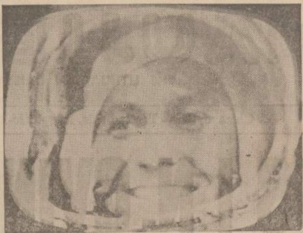
Aviacijos Lt. Plik. Pavel Popovich šypsosi erdvės laive. Paveikslas buvo nuimtas, kai erdvės laivas jau sukosi orbitoje.