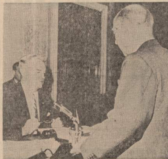
Senato pakomiteto posėdyje įvyko smarkus susikirtimas tarp senatoriaus Stuart Symingtono (kairėje) ir buvusio išdo sekretoriaus George Humphrey, kuris buvo apklaušinėjamas ryšium su karinės medžiagos išteklių supirkimu.

sukviesti naują, visų valdybos narių posėdį, kuriame bus pasiskirstyta pareigomis ir aptarti kiti Alto veiklos reikalai.