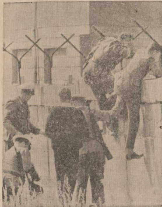
Vakarų Berlyno policininkai padeda berlyniečiams (Vakarų) užlipti ant "gėdos sienos", kad galėtų suteikti pagalbą duoms bėgliams, vienas kurių, komunistų sužeistas, kankinasi 45 minutes, kol mirė. Kitam bėgliui pasisekė laimingai pabėgti.