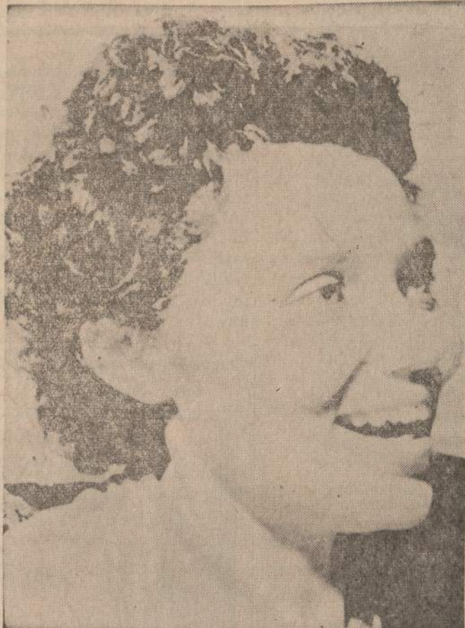
Kosmonauto Pavel Popovič žmona jaučiasi laiminga, patyrusi apie savo vyro nusileidimą žemėn iš erdvės. Ji yra Sovietų lakūnė.