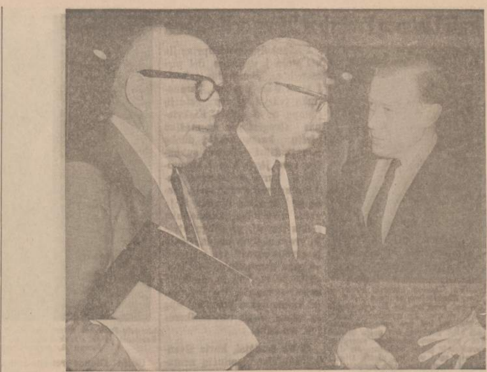
Darbo sekretorius Arthur Goldberg kalbasi su automobilių darbininkų unijos vadu Reuther ir AFL-CIO prezidentu George Meany (karėje).

Dabar pavergtoje Lietuvoje pradžios mokyklose rusų kalba privalomai dėstoma jau nuo antro skyriaus. Ir tiek pradžios, tiek vidurinės mokyklos mokiniai su Lietuvos praeitimi veiks nesupažindinami. Toji Lietuvos istorija yra nustelbta Rusijos imperijos istorija. Lietuvos buvę kunigaikščiai nuvertinami kaip negabūs šalį tvarkyti, gobšūs pralobti, žmones išnaudoti, o Rusijos to meto carai parodomi kaip geri valstybininkai, siekiant visas slavų gimines apjungti ir įsigaleti Pabaltijos pajūryje, idant turėtų vandens kelią susisiekti su Vakarais ir ūkiniai su jais santykiuoti.