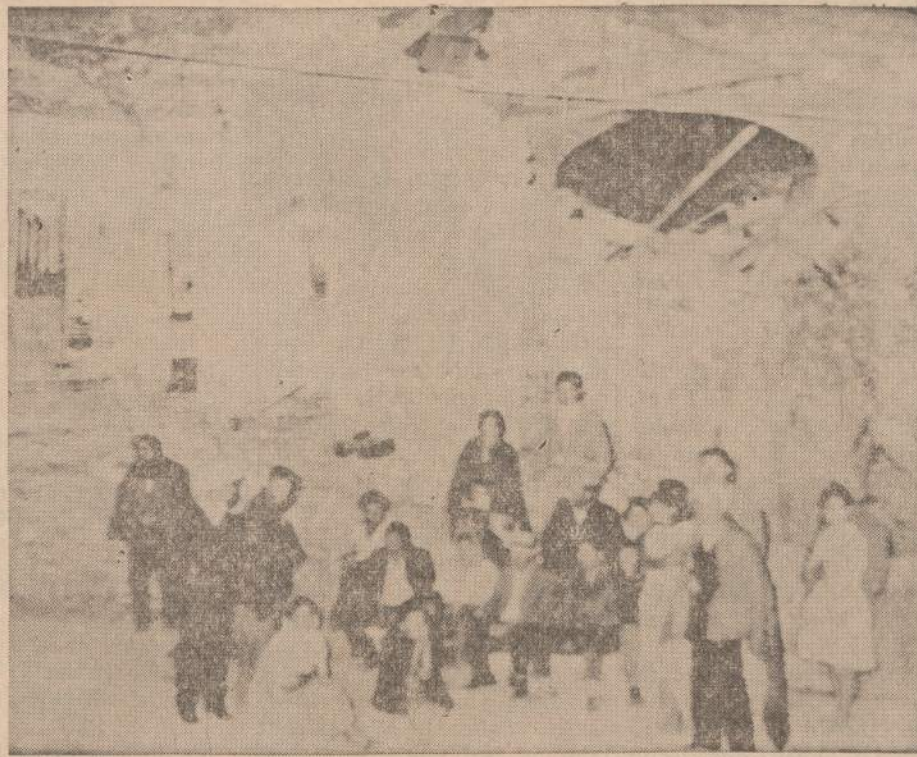
Pietu Italijoje kelintam žemės sudrebėjimui įvykus, žuvo 16 žmonių ir tūkstančiai išbėgiojo į laukus. Vaizde matoma kaimiečių grupė, stovinti prie sukręsto namo.

Bowerio žmonės pasiekia ir Keturiolikto, padaro į ją ekskursijas, o iš Keturiolikto ar per Keturiolikto nueina ir į savo pavėsi — Bowerij. Sutiktas vienas lietuvis, kuris gerai buvo pažįstamas Williamsburge, jo rankų pirštai žėrėjo brangių akmenų žiedais, kišenės dažnai būdavo pilnos dešimčių ir dvidešimčių; karčiamose jo žodis buvo svarus, bet prieš porą metų sutiktas Keturioliktoje pasisakė plaunąs viename viešbutyje indus ir einąs "pas draugus" — į Bowerij. Ar dar jis tebekrapšto tirštas sruilbas iš puodų, ar buvo priimtas į "draugų" tarpą Boweri- je, sunku šiandien pasakyti.