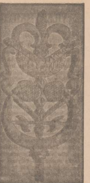
Lietuvių liaudies menas

O kai išvykę iš Gabdanko "atstovybės" "Komunisto" bendradarbiai pavazinėjo po Sovietijos miestus, įvairiose vietose rado Lietuvoje pagamintas prekes su... įvairiais defektais (taigi, skubos darbas... — E.). Pvz., Rostovo universalinėje parduotuvėje buvo matyti kostiumai, kuriuos Vilniaus "Lelijos" fabrikas pasiūvęs pagal seną madą ir dabar prekės neturincios paklausos. Maskvos trikotažo bazėje buvo su laikyta apie 9.000 šiaučūnaitės vardo fabriko trikotažo gaminių — rasta daug defektų, gražinta į Kauną. Vėl Mordovijoje atsisakyta parduoti daugiau, kaip 1.000 porų veltinių — jie buvo blogos kokybės (pagamino Anykščių "Spartako" fabrikas). Nusiskundimai, reklamacijos dėl Lietuvos fabriklų, gamyklų produkcijos, kokybės, girdi, dar vis gaunamos. Pagal "Komunistą", tai turi