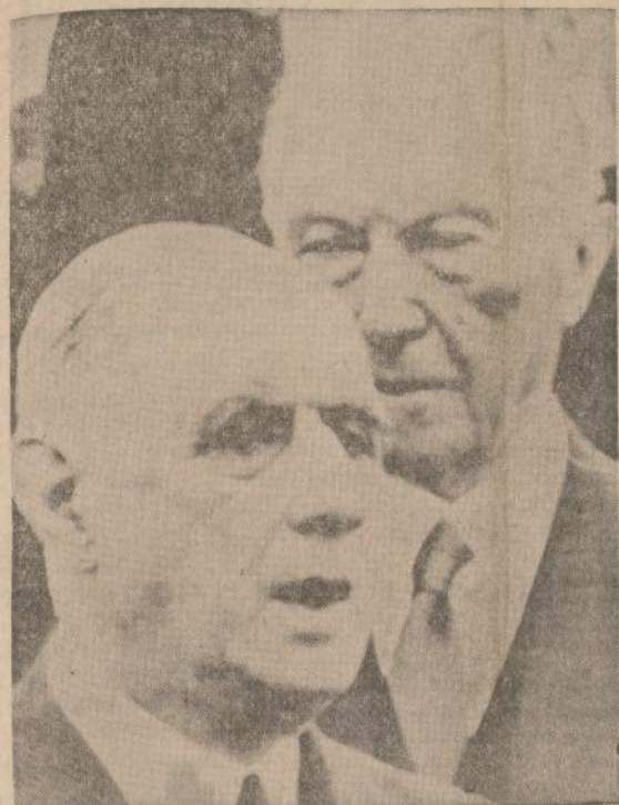
Prancūzijos prezidentas Charles De Gaulle (fonė) atskrido į Boną (Vakarų Vokietijos sostinę) ir aerodrome pasakė kalbą. De Gaulle užnugarėje stovi Vokietijos kancleris Konrad Adenauer.

Pagal Lietuvos vokiečių Landsmannschafto Vokietijoje, Neuhauseim-Huesten, duomenis, įvairiose Sovietijos srityse dar gyvena per 5,000 Lietuvos vokiečių. Pažymėtina, kad grįžtančiųjų Lietuvos vokiečių tarpe randama ir lietuviai tautybės asmenų. (E)