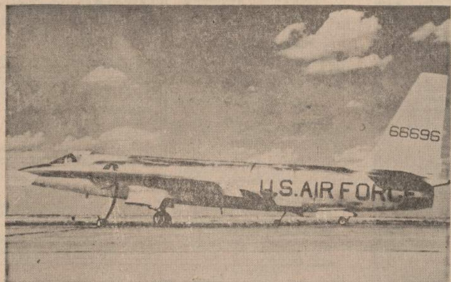
Sovietai pasiuntė JAV notą, kaltindami, jog kinas Amerikos U-2 lėktuvus skridęs virš sovietų teritorijos į šiaurę nuo Japonijos.