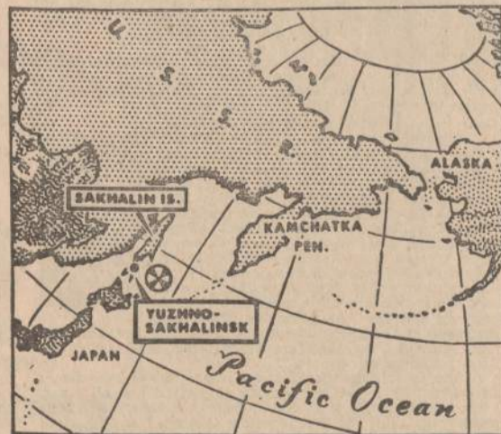
Šis žemėlapis parodo vietą, kur menamai Amerikos lėktuvas U-2 skrido viršum Sovietų teritorijos (viršum Sachalino salos, kuri yra į šiaurę nuo Japonijos).

TOKIJAS. — Peipingo radijas skelbia, kad Indijos pasienio kariniai vėl apšaudė kinų sargybinius Himalajų srityje prie Chip Chap upės. Dėl indų peraros komunistų sargybiniai turėję atsisraukti.