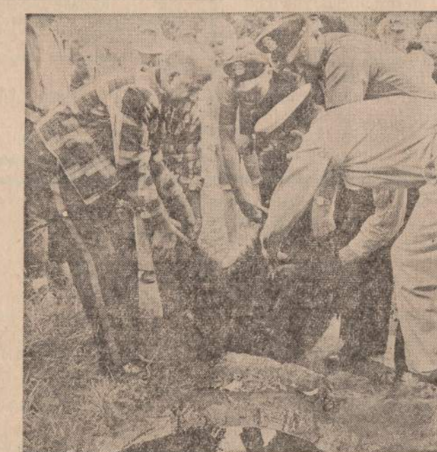
Meška aplankė East Portland (Oregon) ir pusėtina išgąsdino gyventojus, bėginėdama gatvėmis apie tris valandas. Negalėdama gyva pagauti, pagaliau miesto ir apskrities policija buvo priversta nušauti mešką.

matika ir fizika". Jeigu nori sužinoti naujaušias ir tikriausias žinias, kas dedasi pasaulyje ir okupuotoje Lietuvoje — skaityk dienraštį "Naujienas".