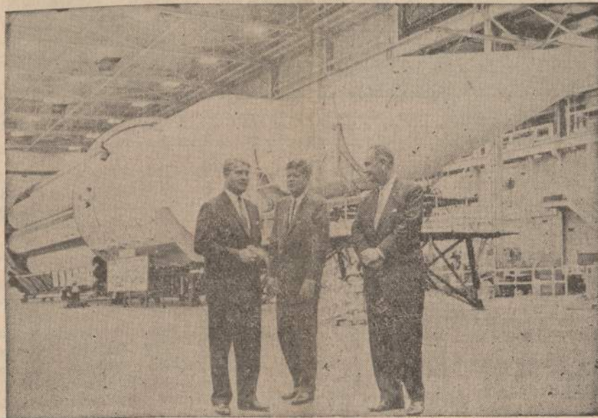
Dr. Werner von Braun (kairėje), George Marshall erdvės skraidymo centro direktorius, aiškina prezidentui Kennedy ir viceprezidentui Johnson (dešinėje), kaip veikia Saturn G-1 raketa (matosi fone). Tos milžiniškos raketos pagalba tikimasi paleisti žmogų į mėnulį.

MASKVA. — Mongolijos komunistų partijos centro komitetas patvirtino Kremliaus reikalavimą pašalinti iš partijos pirmininką Tumur-Ochir dėl jo "antipartinės veiklos". Tasso agentūra gana aiškiai pasakė, kokio pobūdžio buvo jo apartinė veikla: nepaisęs nacionalizmo pasmerkimo ir nestiprinęs "internacionalinio švietimo", atseit, jis buvo dar šoks toks savo šalies patriotas.