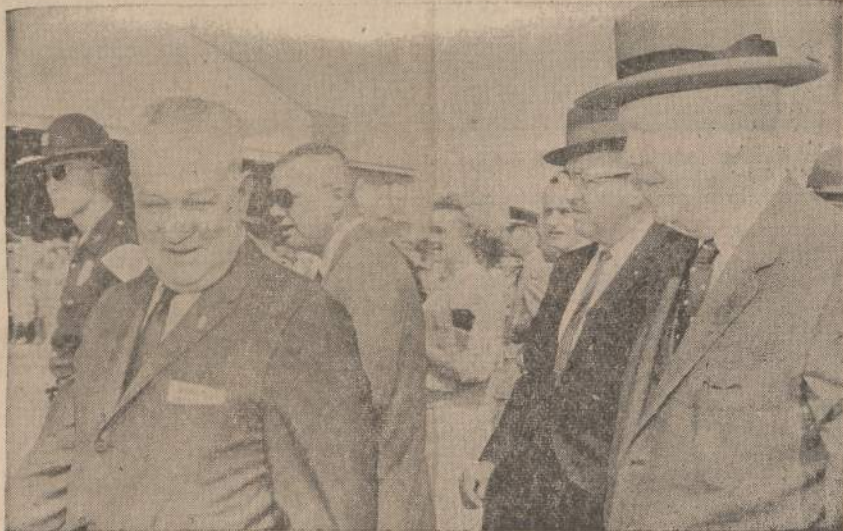
Buvęs prezidentas Dwight D. Eisenhower eina su Charles Halleck, kuriam Lafayette (Ind.) buvo surengta "Hallecko Diena". Halleck yra mažumos vadas kongrese, jis vėl kandiduoja į kongresą.

H. Cleveland mokė savo delegacijos narius Jungtinėse Tautose, kad jie nekeltų žibančių rezolucijų, kurių Amerika negali įgyvendinti. Jungtinės Tautos esančios ne orinių protestų vieta, bet vidaus, už durų sambūris rimtiems svarstymams.