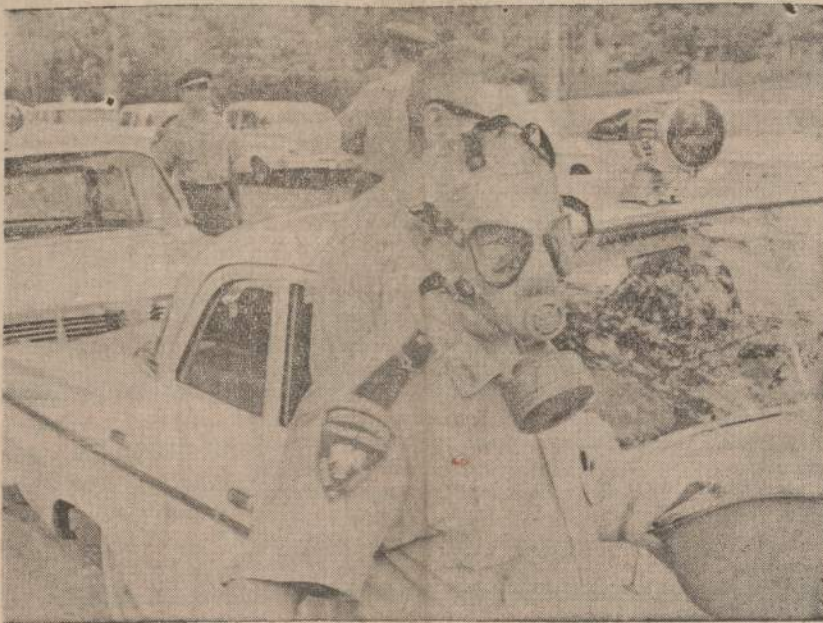
Mississippi plentų policininkai prie universiteto Oxford mieste. Jie yra pasiruošę neišleisti federalinės valdžios pareigūnų su negru studentu James Meredith.

SEOUL, Pietų Korėja. — Karuomenės teismas nuteisė 10 metų kalėjimo buvusį ministrį pirmininką Dr. John Chang. Jis finansavęs generolus, kurie ruošė pasikesinimą prieš dabartinį diktatorių gen. Chung Hee Park. Dr. Chang sudarė vyriausybę po diktatoriaus Syngman Rhee nušalinimo ir pirmų laisvų rinkimų pravedimo 1960 m. 1961 m. de-