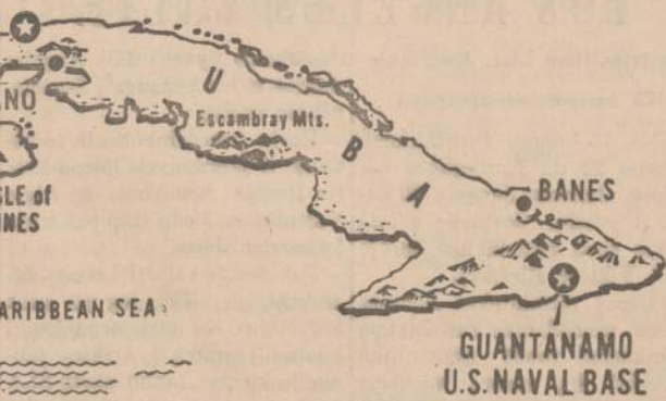
Havanos radijas pranešė, kad Kuboje bus pastatytas sovietų žvejybos uostas, kuris kainos dvjilika milijonų dolerių. Jis būsiąs įrengtas Havanos įlankoje ir turėsias radijo stotį.

Kuriant komunistinę visuomenę, reikia išspręsti du uždavinius — sudaryti materialinę-techninę komunizmo bazę ir išaukšti aukštos kultūros žmogų, mokantį ne tik jungti mokslą su gamyba, įgyvendinti sparčius mokslinės-techninės pažangos tempus, bet sugebanti giliai marksistiškai pažinti gamtos ir visuomenės vystymosi dėsnius. Jei aukščiau pakakdavo, charakterizuojant darbo pirmūną, pasakyti "jo auksinės rankos", šitoks domėjimasis išlieka labai ilgai. Dėl tos priežasties vaikas laikotarpiai reikia kiekvienam komunistinio darbo pirmūnui turėti ne tik "auksines rankas", bet ir "auksinę galvą". Tai reiškia, kad vien praktinės žinios be ryšio su teorija, su tarybinio mokslo pasiekimais negali sėkmingai išspręsti tų uždavinių, kurie keliami Partijos Programoje.