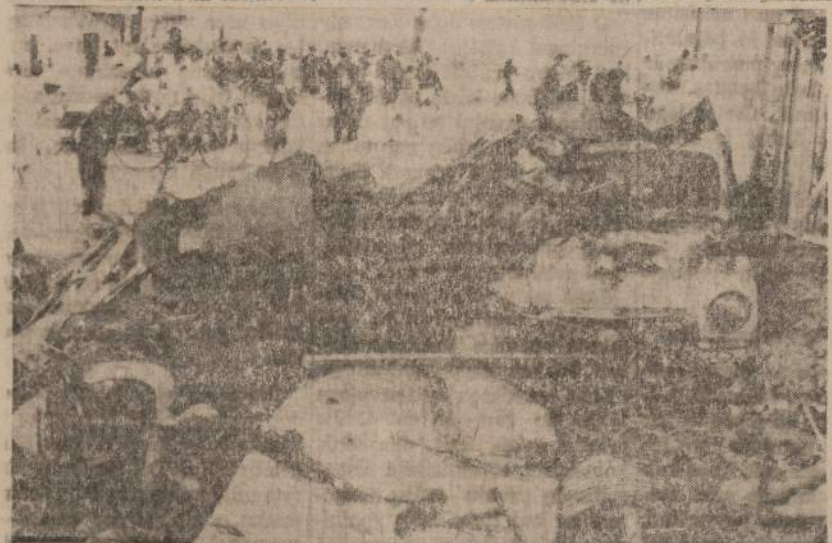
Didžiausio Ispanijos istorijoje potvynio pasekos. Šis vaizdas parodo Tarrasa apylinkę po potvynio.