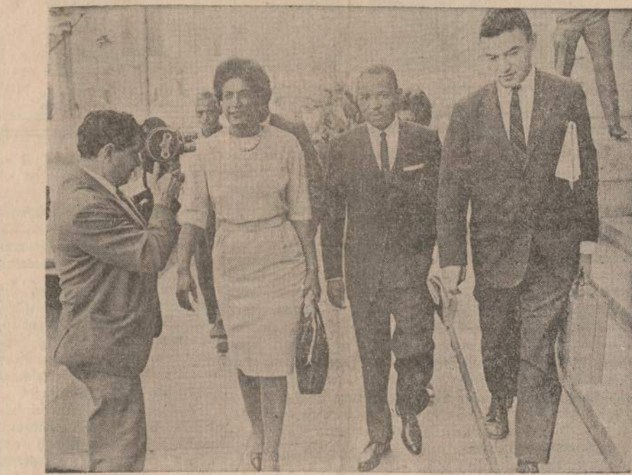
James Meredith (viduryje; iš šalių advokatai Constance Motley ir Jack Greenberg) atvykę į federalinį teismą New Orleans mieste, kur buvo svarstoma byla prieš Mississippi gubernatorių Ross Barnett.

Prez. Kennedy pasiuntė Ben Bellai sveikinimo telegramą. Ben Bella ruošiasi važiuoti į Ameriką, įteikti Jungtinėms Tautoms prašymą apie Alžerijos priėmimą ir tartis su JAV vyriausybe dėl paramos savo skurstančiai respublikai.