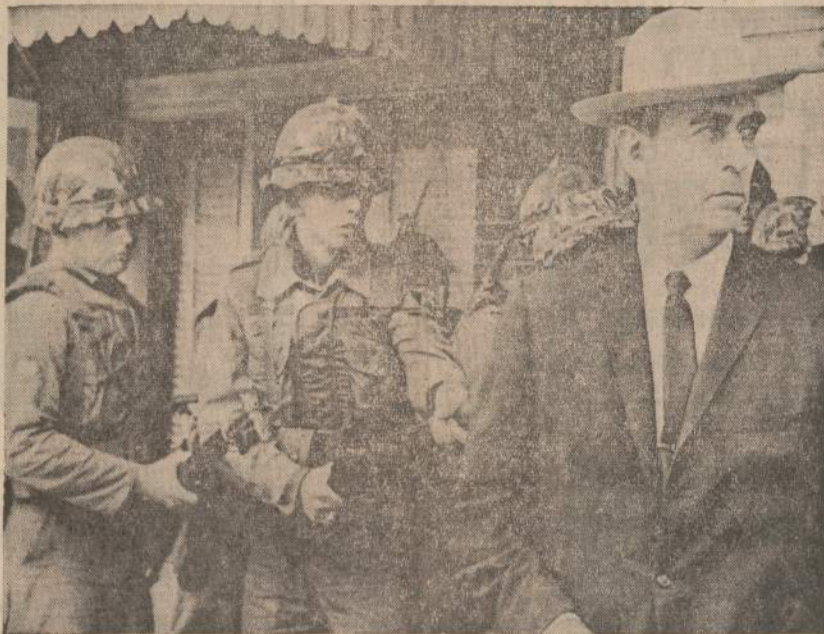
Buvęs generolas Maj. Edwin A. Walker buvo išvestas karių su atkūtais durtuvais, kai jis atsiskė apieisti Oxforde (Miss.) teismo rūmus. Atrodo, kad jis bus kaltinamas už maišto kėlimą.

Kolonji paprašė JT įgaliotinį Robert Gardiner tarpininkauti jo vaiduose su Konge premjere Adoula. Gardiner patarė užmegzti tiesiogines taikos derybas.