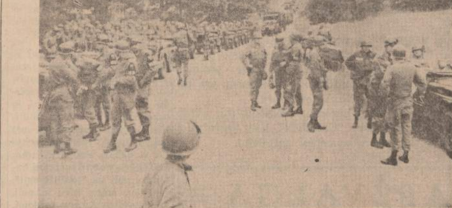
Federalinė kariuomenė, surikiuota prie kelio, yra paruošta bet kokiems įvykiams prie Missisipi universiteto, esančio Oxford, Miss.