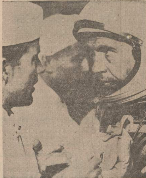
TREČIASIS AMERIKOS ASTRONAUTAS WALTER SCHIRRA. Jis trečiadienį padarė erdvėmis dvigubai ilgesnę kelionę už savo draugus John Glenn ir Scott Carpenter. Jis apskrido žemę beveik šešis kartus.

tais pinigais JT nori sutvarkyti savo finansus, kurie visiškai pašijo dėl plataus užsimojimo Kongo, sukurti ten taiką, ramybę.