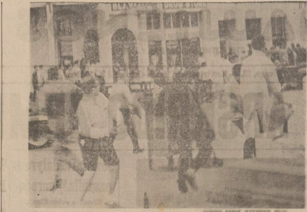
Mississippi universiteto studentai, susijūnke prie feismo rūmų, meta į Karjūomėne akmenis, butelius ir kas tik pakliūva į rankas. Karjūomėne buvo priversta prieš maistaujantius studentus panaudoti ašarines bombas.

Po kom. partijos suvažiavimo buvo iškilęs klausimas dėl vadovavimo komunistų judėjimui. Tiesa, Chrusčioviui nepavyko į savo rankas pag-