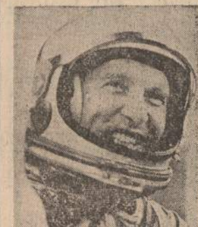
Astronautas Walter Schirra šyposi prieš eidamas į erdvės kapsulę, kurioje jis apskrido šešis kartus aplink žemę. Kapsulė buvo paleista į erdvę iš Cape Canaveral, Fla.

Prezidento galią kiek suvaržė pats kongresas, pasilaikydamas sau teisę tvirtinti premjerą su ministeriu kabinetu. Goulart nori šią teisę grąžinti sau. Prezidentinės santvarkos grąžinimui pritaria nemaža jo opozicinių iš socialdemokratų ir nacionaldemokratų partijų. Buvęs prezidentas Kubitček, įtakingas socialdemokratų senatorius, yra priešingas dabartinei "parlamentinei" sistemai, įvestai tik iš bėdos ir ne konstituciniu keliu.