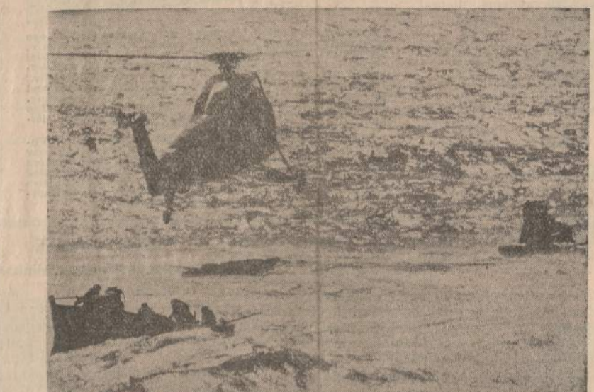
Kai astronautas Schirra nusileido iš erdvių į vandenį, netoliase jau buvo lėktuvneiš Kearsarge, o viršuje skraidė helikopteris.

MASKVA. — Suomijos prezidentas Dr. Urho Kekkonen ir žmona atvyko dviejų savičių atostogų prie Juodosios jūros kaip Nikitos Chruščevo svečiai. Kiek pabuvę Maskvoj, jie išvyko į Sočio vasarvietą.