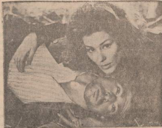
Irina Demich ir Christian Marquand, vaidinantieji Prancūzijos pagrindinio vadybos "Ilgiausioje Dienoje". Čia pavaizduotas jaudinantis momentas, laukiant invazijos Normandijos pakrastyje. Filmas pradėdamas rodyti B. & K. Roosevelt kine, State St., arti Washington, ketvirtadienį, spalio 11 d.