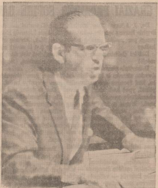
Osvaldo Dorticos, Lietuvos Tautų susirinkime kelis kartus triukšmąjančios publikos buvo nutraukta.

tūras, kaupiant pašarus. Taigi, jei žemdirbiai nenoriai imasi darbo, dar kliudo ir nepalankios oro sąlygos, tai, tikimasi, padėti gelbės propagandistai. Kaip ma-tyti, jiems užkraunama daug pa-reigų ir būtų neįtikėtina, kad bent viena jų jie sugebėtų at-likti prideramai. O jei agitaci-jos darbų vadovas kalba, kad ko-munizma pavyks lengviau skie-pyti, jei, girdi, jau likviduoti as-menybės kulto padariniai ir įvy-kę milžiniški technikos, mokslo laimėjimai (anot jo — legenda-riiniai skridimai į kosmosą), tai šiuo atveju tektų abejoti ir op-timizma palikti patiems komu-nistams. (E)