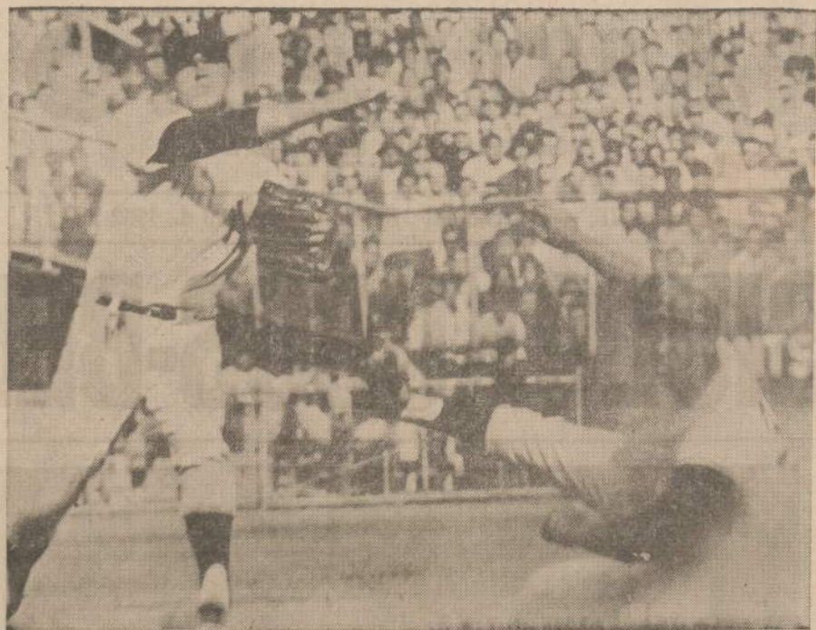
Yankee beisbolo komanda laimėjo trečias žaidynes su Giants komanda. Žaidžiama dėl čempiono titulo. Rungtynių santykis dabar yra 3 prieš 2. Yankee naudoi.

mes vyrai taip ir sėdėsime kaip žemę pardavę.