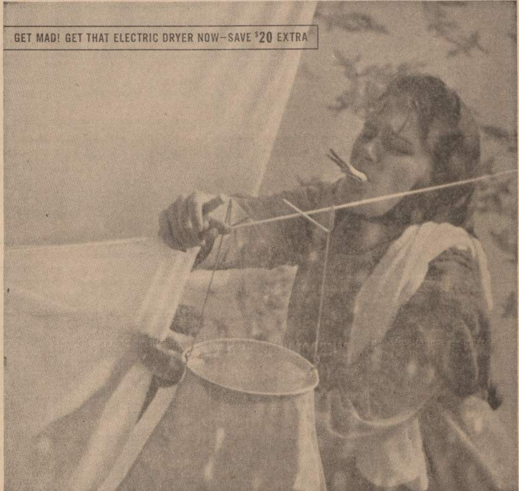
GET MAD! GET THAT ELECTRIC DRYER NOW—SAVE $20 EXTRA

JEI NENORI ATSLIKTI NUO PASAULIO ĮVYKIŲ — SKAITYK "NAUJIENAS" — JOS TEIKIA GERIAUSIAS, TEISINGIAUSIAS ŽINIAS