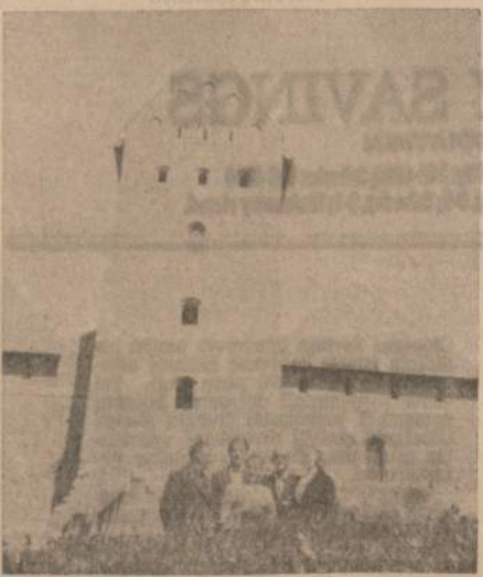
Restauruotos Trakų pilies bokštai

Tai buvo teisingi žodžiai. Vilniuje parvažiavus amerikietį pirma pamazgoms apipila, o vėliau stengiasi sugadinti nuotaiką atitaisyti. Tuo tarpu Trakuose jį priima atviro širdim. Jeigu nuvažiuotum dar giliau į Lietuvą, tai amerikietis dar nuosirdžiau būtų priimtas. Taip kalbėjom, bet man atrodė, kad ir Trakuose aš buvau gražiai sutiktas pa-