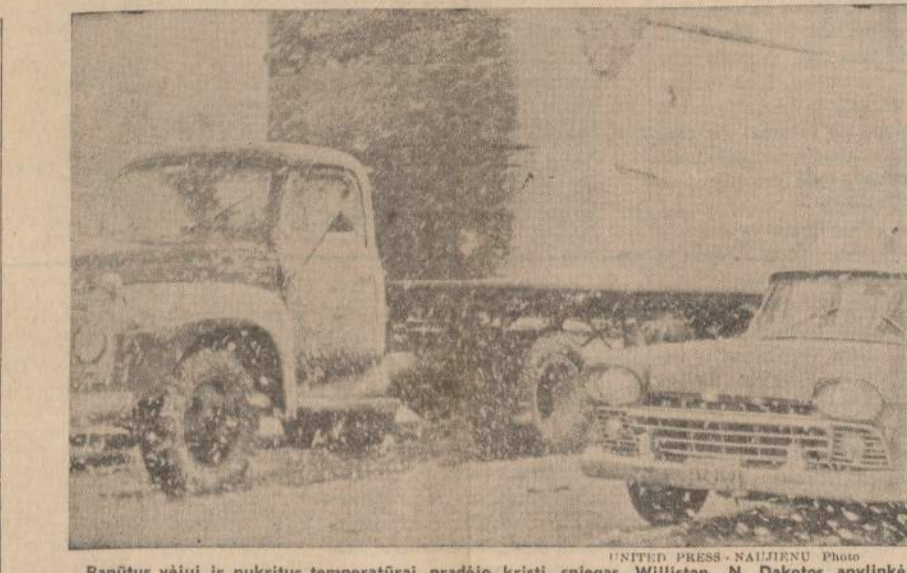
Papūtus vėjui ir nukritus temperatūrai, pradėjo kristi sniegas Williston, N. Dakotos apylinkėj.

Visos šios šnekos turi būti užrašytos mažiausia trim kalbom — anglų, prancūzų ir ispanų. Kiti svarbesni dokumentai dar turi būti išversti į rusų bei kinų kalbas. Taip, kad viską sudėjus pernai JT pilnatis susirinkimas su savo komitetais pagamino 306,370,000 lapų protokolų, užrašų. 1952 metų gamyba buvo perpus kuklesnė, "tik" 177 milijonai lapų.