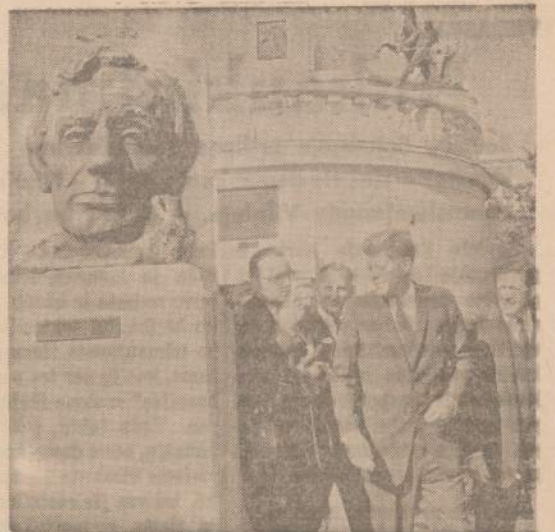
Prezidentas Kennedy Illinois sostinėje, Springfielde, padėjo vaikui prie Abraham Lincoln kapo.