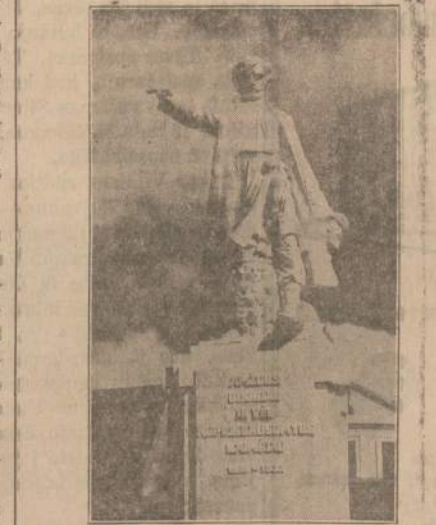
Nepriklausomoje Lietuvoje, Raseiniuose imta žemaičių fotografija

Žemaitis karo metu nenukentėjo. Buvo sudeginti rinkos srityje buvę namai, bet pati stovyla nepaliesta. Privažiavus