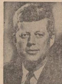
PREZIDENTAS J. F. KENNEDY, padaręs pirmadienį svarbų užsienio politikos sprendimą.

Kalbos pabaigoj jis kreipėsi į Kubos tautą, užtikrindamas JAV geriausius norus, grąžinti jai laisvę, nepriklausomybę nuo dabar tinu valdytojų, revoliucijos išdavikų, pasidariusių svetimos valstybės agentais.