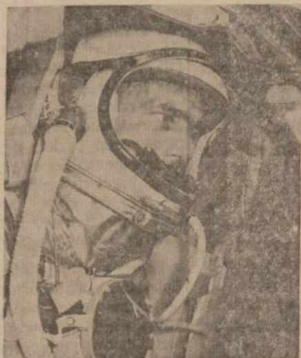
M. Scott Carpenter, Project Mercury, NASA, fourth U.S. astronaut in space, second American to orbit the earth.

says M. Scott Carpenter, Mercury Astronaut, who's doing his own share of helping to preserve freedom