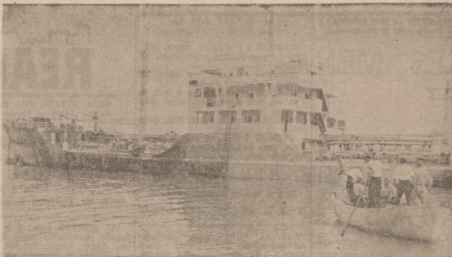
Norvegų "Boheme" motorlaivio igula. Motorlaivis susidūrė su baržų vilkiku ir sudėgė. Dešimtis igulų narių žuvo, keli buvo sužeisti, o apie aštuonių likimą kol kas nėra žinių.