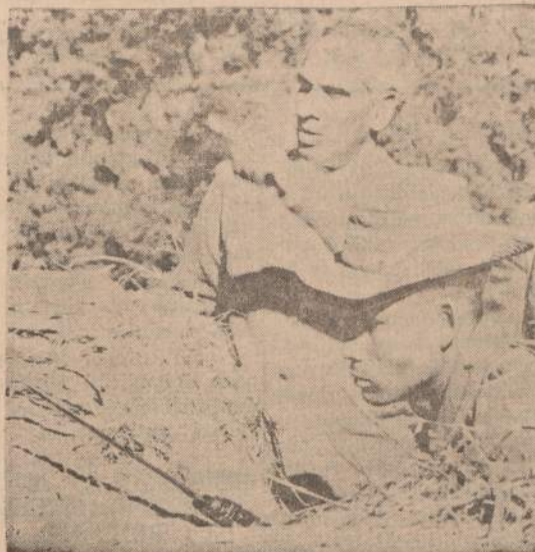
Indijos gynybos ministeris V. K. Krishna Menon (kairėje) prieš kurį laiką aplankė Lemekingą įsitvirtinimus prie kinų sienos. Dabar toje vietoje eina mūšiai ir kinai gerokai pasitūmėjo pirmyn.