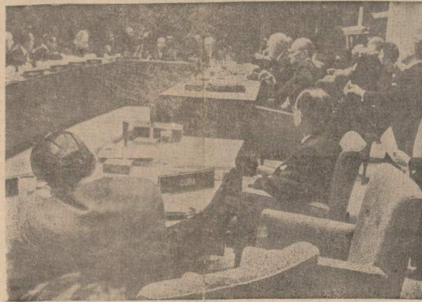
Amerikos Valstybių Organizacijos tarybos posėdis dėl Kubos krizės. Organizacija priėmė rezoliuciją, kuria reikalaujama likviduoti Kuboje ofensyvas bazines.

rus padėti Amerikai individualiai ir kolektyviai įgyvendinti Kubos blokadą, Argentina ir Kostarika trečiadienį pasiūlė prisidėti savo laivais, lėktuvais prie blokados sustiprinimo. Venecuela ir kelios kitos respublikos netrukus paseks Argentinos pavyzdžiu.