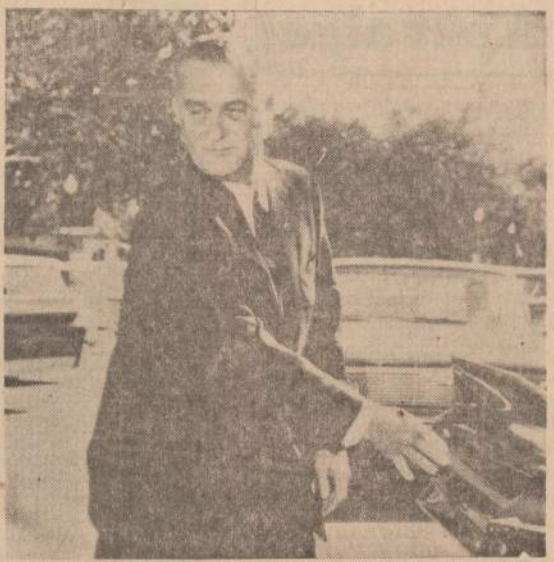
Ryšium su susidariusia rimta tarptautine padėtim viceprezidentas Lyndon B. Johnson atvyko į Baltuosius Rūmus.