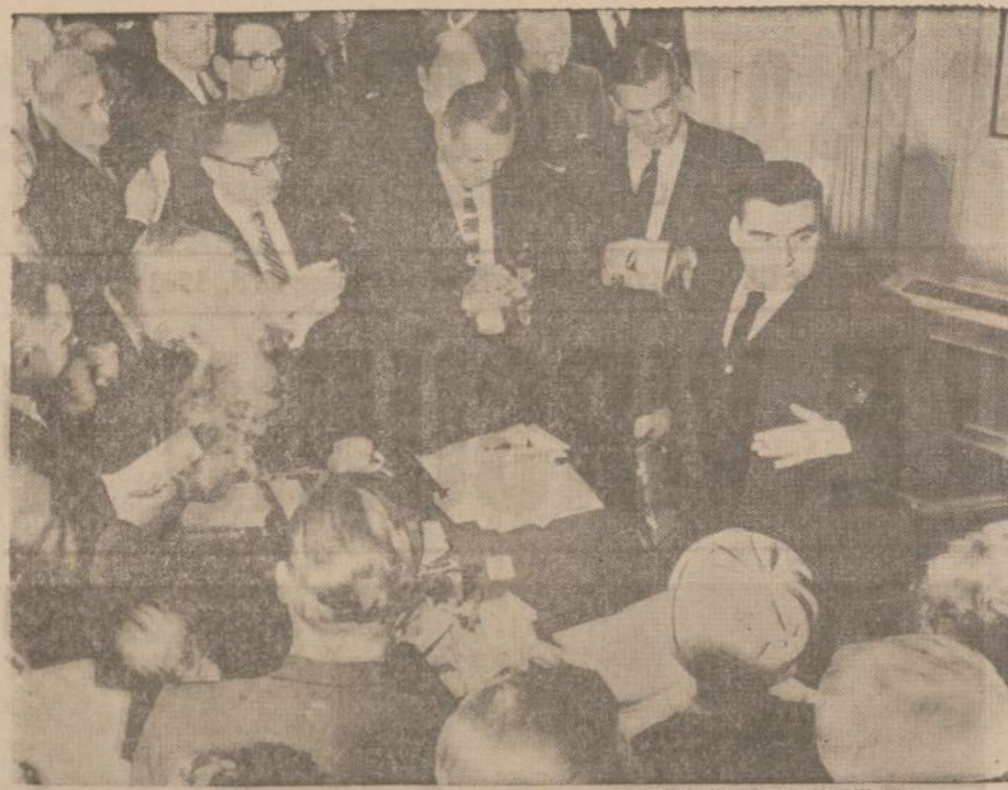
Baltųjų Rūmų spaudos sekretorius Pierre Salinger (dešinėje) praneša reporteriams, kad prezi- dentas Kennedy ryšium su susidariusia rimta tarpautine padėtimi pasakys per televiziją kalbą.

Važiuojame jau ir su kiškiu rog'se. Tėvelis sako: Na, vai- keli, turėsime skanios kiškio- nos". O aš neiškenčiau ir vis ranką po gūnią pakišęs pa-