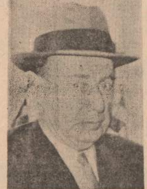
Amerikos ambasadorius Jungtinėms Tautoms Adlai Stevenson atvyksta į Saugumo Tarybos posėdį.

Britų laivų kompanijos mano, kad jos, laikantis JAV blokados sąlygų, galės ateity gabenti maistą bei šiaip vartotojų prekes, o gal ir „defenzyvinius“ ginklus.