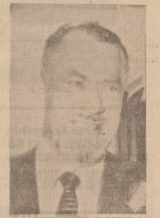
Amerikos rašytojas John Steinbeck, kuris laimėjo Nobelio literatūros premiją.