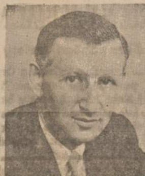
SIDNEY R. YATES U. S. Senator

BALSUOKITE UŽ VISĄ (X) DEMOKRATŲ SAŖAŠĄ!