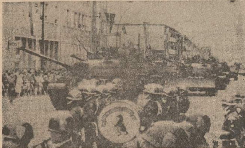
Sunkieji tankai ritsai Berlyne Wilhelmgtvėj. Tai trečias Amerikos kariuomenės toks paradas Berlyne.