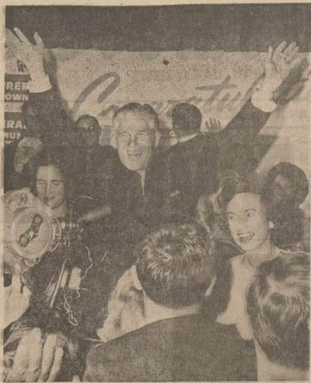
George Romney, kuris buvo išrinktas Michigan valstijos gubernatorium. Jis kandidatavo respublikonų sąrašą.