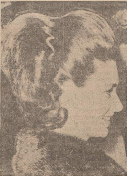
Princesė Margaret atvyko į Londoną surengta labdaros baliu su pikantiškai sutaisytais plaukais. Tėtai Londone sukėlė tikrą sensaciją.

Žinia jau visus seniai yra pasiekusi, kas tik rinkimais domisi, kad respublikonų kandidatas R. Nixon pralaimėjo rinkimus. Neišrinktas į Kalifornijos gubernatorių, jis paskutinėje spaudoje konferencijoje pareiškė, jog planuoja "ilgas — ilgas šventes". Pasitrauks iš politikos darbo. Labai grubiai jis atsisveikino su spaudoje korespondentais. Kliuvo ir pačiam L. A. Times, taip, kad net pats L. A. Times