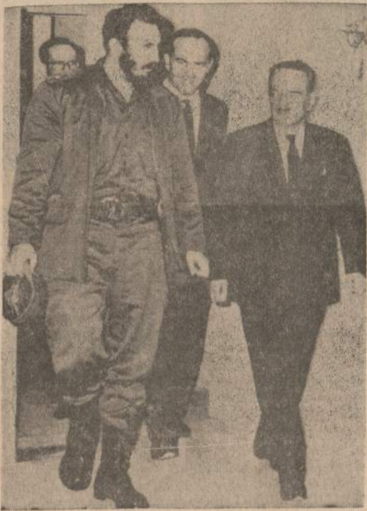
Kubos premjeras Fidel Castro ir Sovietų pirmas vicepirmininkas Anastas Mikojan išeina iš ministerių posėdžių kambario Havanoje.

SOFIJA, Bulgarija. — Bulgarijos prezidentas (aukščiausiosios tarybos prezidento pirminkas) Dimitir Ganev išdėstė komunistų partijos suvažiavime planą apie naują konstituciją. Pagal ją aukščiausiajai tarybai (seimui) bus suteikta daugiau teisių šalies valdyme, įstatymų leidime. Komunistų šalių seimai tik patvirtina, ką komunistų partijos centro komitetas nutaria.