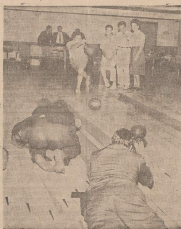
Ši nuotrauka buvo nuimta Illinois atletų klube Chicagoje ryšium su prasidėjančiomis rutulio ritinimo rungtynėmis.

MOVING Leidimai — Pilna aprauda ZEMA KAINA R. SERENAS 2047 W. 67th Pl. WAilbrook 5-8063