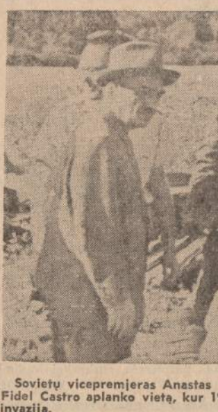
Sovietų vicepremjeras Anastas Mikojanas ir Kubos premjeras Fidel Castro aplanko vietą, kur 1961 m. buvo padaryta nesėkminga invazija.

Komunizmui kovoti Amerika turinti būti nuolatinėje karinėje paruošoje.