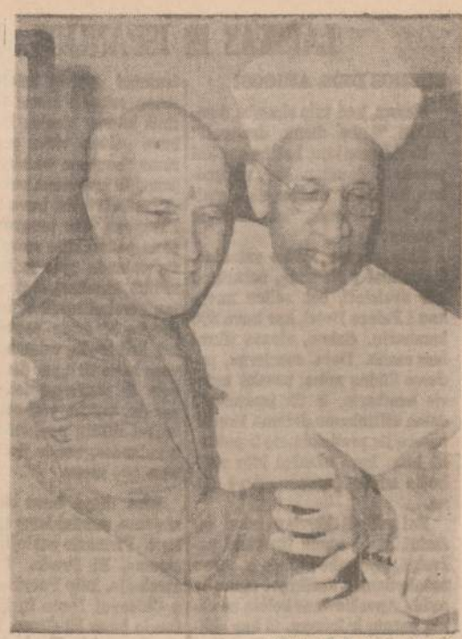
Indijos premjerui Nehru (kairėje) sukako 73 metai amžiaus. Sukakties minėjimo proga jį šiltai pasveikino Indijos prezidentas Sarvapalli Radhakrishnan.

Jaunas Chruščiovas buvo šiaip linksmo būdo, nedidelio ūgio mėgstas armonika, išgerti vėdros, tik ne per daug, ir savo judriomis ačimis ukrainietes mergiotes sekt. Geriausias norais komunistų "istorikai" negali surasti, kur ir nuo kada pradėti Nikitai daugiau raudonos spalvos užtepti.