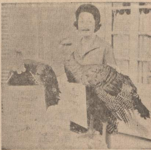
Viceprezidento Lyndon Johnsono žmona su 40 svary kalakutu, kurį viceprezidento ir prezidento šeimoms, Padėkos Dienos progai, įteikė Nacionalinė kalakutu auginimo federacija.

Minėtasis komitetas praėjusiais metais šelpė 252,000 žydų. Didžiausioji naujųjų pabėgėlių ir pagalbos reikalingųjų dalis esanti Prancūzijoje, daugiau kaip 100,000 vien tik iš Alžirijos.