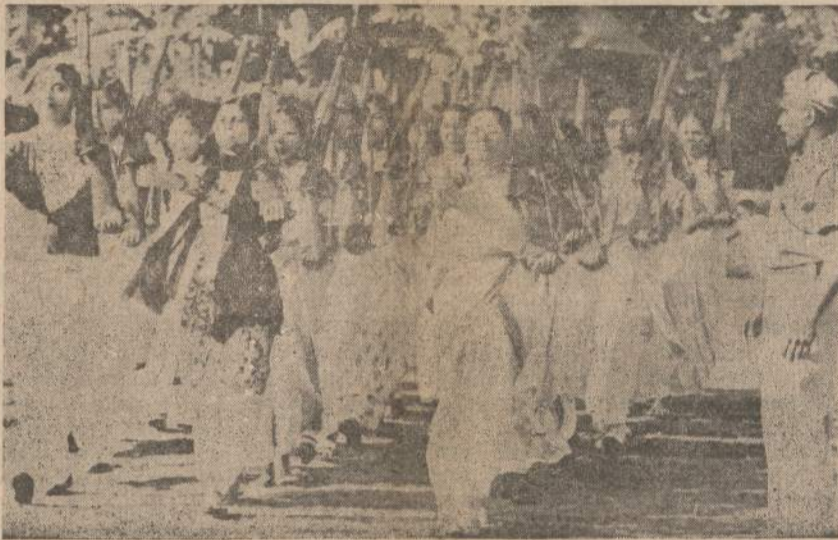
Indijos armijos instruktorius vadovauja gallesingųjų seselių, mokytojų ir šeiminių karo pra-tybai Tezbur mieste, Indijoje.

— Maironio 100 m. gimimo metinių proga Lietuvoje išleista Maironio kūrybos rinktinė — ją redagavo (žinoma, kruopščiai išsijoję, atrinkę paskirus eilė-raščius — E.) K. Korsakas, E. Mieželaitis ir A. Venclova.