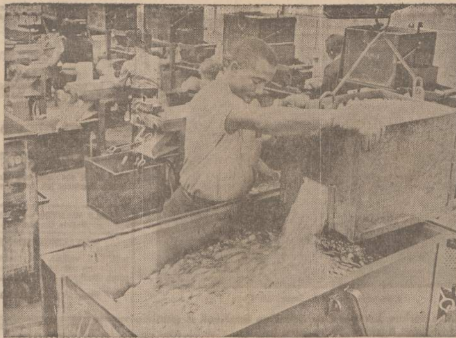
Amerikos pinigų kalykloje, esančioje Philadelphiaje, smarkiai dirbami kvoteriai, kurių ryšium su besitarinčiomis žiemos šventėmis pasireiškė trūkumas.

7159 SO. MAPLEWOOD AVE. CHICAGO 29, ILL.