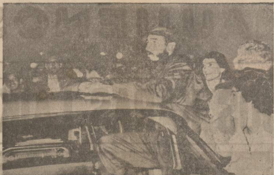
Kubos premjeras Fidel Castro aplankė Havanos universitetą, kur jis praleido laiką besikalbėdamas su studentais.