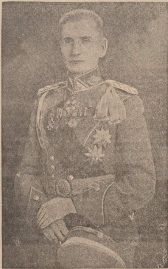
Gen. SILVESTRAS ŽUKAUSKAS, Pirmasis Lietuvos kariuomenės vadas

Baigiantis Pirmajam Pasauliniam karui, 1918.XI.23 dieną buvo išleistas pirmas įsakymas Lietuvos kariuomenei. Dėl to ta diena ir virto istorinė.