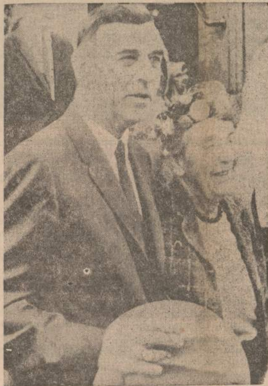
Oxford (Miss.) federalinio teismo teisėjas Claude Clayton pareiškė, jog jis pripažins doktaro paludijimą, kad buvęs generolas Walker nėra pusiausvyros netekęs. Čia parodomas Walker ir jo motina, kai jisėjo į teismo rūmus.

Lazarą Kaganovičių Nikita pašalino 1957 metais iš vyriausybės ir politbiuro ne kaip žydą, bet kaip stalinistą, kuris buvo susidėjęs su "antipartine grupe", vadovauta Molotovo ir Malenkovo.