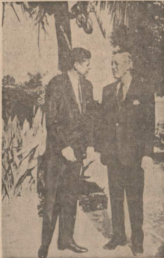
Prezidentas Kennedy (kairėje) ir Anglijos premjeras Macmillan tariasi Nassau mieste, Bahamų saloje.

KAMPALA, Uganda. — Šios naujos Afrikos respublikos prezidentas paskelbė amnestiją politiniams teroristams, jei jie padės ginklus ir grįš iš džunglių į normalų gyvenimą. Bet dvidešimt penki tokie sugrįžėliai buvo sukapti už priklausymą teroristams.