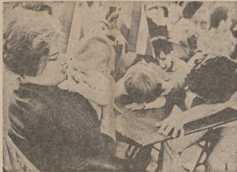
Miami (Fla.) mieste gyvena kubiečiai laukia savo artimųjų, kurie buvo sumiti pernai po nesėkmingos invazijos. Dabar jie paleidžiami iš kalėjimų, kurie buvo leidžiama vykti į Ameriką. Faktiškai jie yra išperkami, nes už juos Kubos valdžiai sumokama medikamentais.

Prezidentas prieš trejetą mėnesių panaudojo Taft-Hartley įstatymą nukelti krovėjų streiką 80-dia dienų. Siam laikotarpiui praėjus, vyriausybė jokios galios nebeturi. Streiko likvidavimas pareina tik nuo darbininkų ir darbdavių susitarimo. Laivų sustabdymas duos kraštui daug milijonų nuostolių.