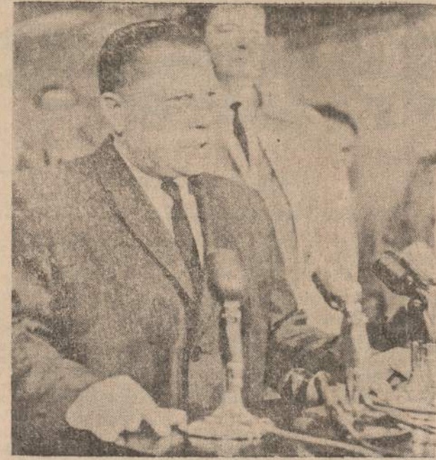
James Hoffa, Izerių unijos prezidentas, buvo teistas Nashville (Tenn.) federaliniame teisme, tačiau jūrą negalėjo susitari ir byla buvo išmesta. Hoffa buvo kaltinamas "milijono dolerių sąmokslu".

— Jei tamsta turėtum išvardinti dešimtį geriausių žmonių savo mieste, kas tie kiti devyni būtų?