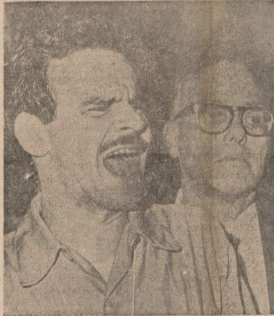
Manuel Artime, kuris pernai vadovavo nesėkmingai invazijai į Kubą ir už kurio suėmimą Castro valdžios buvo skiriama $500,000, Kubos pabėgėliams Miami mieste pasakė kalbą, pareikšdamas, jog jie nepalies kovoję už Kubos išlaisvinimą.

Neymayer yra garsus architektas. Pagal jo planus buvo pastatytas JT dangoraižis New Yorke ir beveik visa naujoji Brazilijos sostinė Brasilia.