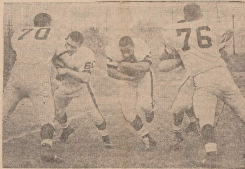
Wisconsin universiteto futbolo komanda treniruojasi Brookside parke (Pasadena, Calif.). Sauso 1 d. ji rungsis su Southern California universiteto komanda vadinamoje "Rose Bowl" žaidynėse.

Žemės ūkio srityje Sniečkus pripažino didelį vaidmenį gamybinėms valdyboms, esą, jų dėka organizuota sėja, nuimtas derlius. Tačiau, girdi, dėl nepalankių oro sąlygų, žemės ūkyje nepasiekta "numatytų rodiklių", dėl to buvęs gautas mažesnis, negu pernai, žemės ūkio kultūrų derlius. Be to, Lietuvoje neįvykdytas grūdų ir kitų augalininkystės produktų pardavimo valstybei planas. Kad kolchozinių būklė ir toliau sunki, tai liudija Sniečkaus žodžiai, kad šiais metais "šiek tiek padidėjo jų piniginis apmokėjimas už darbdavienius". Jiems avansuoti per 9-nius 1962 m. mėnesius buvo išmokėta 25 mil. rublių, tai sudarė 25% daugiau, negu perėjais metais. Girdi, vis dar esą trūkumai atlyginant kolchoziniams, jiems mokant avansus. Sniečkus nurodė: didelė dalis lėšų, skirtų kolchoziniams darbiui apmokėti, panaudojama... išpūstam valdymo aparatui išlaikyti. Žinoma, Chruščiova nusižiūrėjęs, ir Sniečkus aiškina kuku-