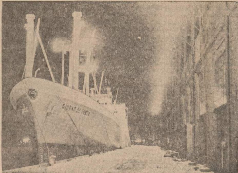
Laivų krovėjai New Yorke tuoj paskelbė streiką, kai pasibaigė 80 dienų "atvėsimo" drausmė pagal Taft-Hartley įstatymą. Tas pat įvyko ir kituose uostuose.