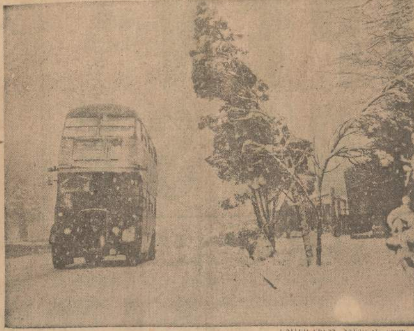
Aštuonias dienas Anglijoje siautė dideli šaltiniai, dėl kurių žuvo 146 žmonės. Vargino ne tik šaltiniai, bet ir nepaprasta sniego pūga. Vietomis sniego pusyniai siekė 15 pėdų.

Jam atrodo, kad JT vis dar siau pradeda veikti kaip pasaulinė valdžia, skelbia karus, areštuoja, deportuoja piliečius.