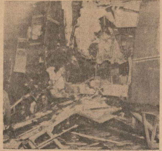
18 žmonių žuvo ir 32 buvo sužeista, kai į Londoną važiuojo greitasis traukinys atsimušė į stovintį keleivinį traukinį.

pasitraukęs, jei iki gruodžio mėn. ir neteisėtoji valdyba jį tebe laikė savo nariu? 3. Trečias klastojimas yra aiškinimas, kad valdybos posėdį gali suaukšti dauguma (4 iš 7) jos narių ir jame daryti teisėtus nutarimus. Gi pagal statuto 18 str. posėdį gali šaukti tik valdybos pirmininkas arba jo įgaliotas valdybos narys. Kitais suaukštus posėdis yra neteisėtas, ir visi jo nutarimai yra neteisėti. Tą patį patvirtino ir Garbės Teismas, kurio sprendimo 4 straipsnis taip skamba: "L. B. apylinkės valdybos posėdžius kviečia V-bos pirmininkas arba jo įgaliotas valdybos narys. Valdybos posėdis yra teisėtas, kai iš anksto visiems valdybos nariams pranešta apie jį ir kai jame dalyvauja dauguma valdybos narių su pirmininku arba jo įgaliotu v-bos nariu (LB ist. 18 str.)