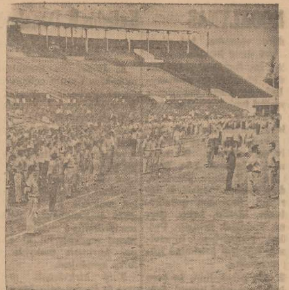
Apie 1,000 išlaisvintu kubiečių susirinko į Miami stadioną pasitikti prezidentą Kennedy ir jo žmoną.

Pasūmiję metų peržengusi žmona savo biznieriui vyrui: — "Kodėl nenori pasakyti, kad samdytum mane savo asmens sekretore, jei nebūčiau tavo žmona?"