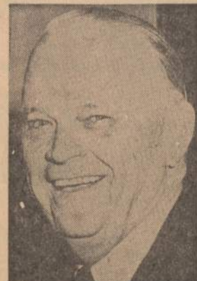
Senatorius Robert S. Kerr mirė nuo širdies smūgio Washingtono. Jis buvo 66 metų amžiaus.

10 pajamų sen. Kerr skirdavo savo bažnyčiai-baptistų. Prezidentas Kennedį pripažino, kad Kerr mirtis buvo skaudus smūgis. Jis dalyvaus penktadienį jo laidotuose. Sen. Kerr buvo milžiniškos išvaizdos, 6 pėdų, 4 inčijų, nerūkė ir negėrė. Paliko žmoną, tris sūnus ir dukterį.