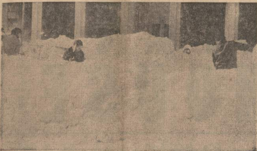
Automobilistas, pasikvietęs savo draugus, bando atkasti beveik visiškai užpustytą savo automobilį Bangor (Ma.) mieste. Vietomis sniego pusnis siekė 20 pėdų gilumo.