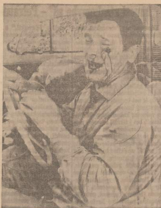
Belgas angliakasy sėdi sužeistas automobilyje šalia savo nušautos žmonos lavono Jadvilke mieste, Katangoje. Tai aukos kruvino susiremimo Jungtinių Tautų kariuomenės su prezidento Tshombės šalininkais.

Jei šių dienų krikščionys demokratiai laikytųsi tokių idėjų, tai jų tikrai nebūtų nė vienos demokratinės šalies valdžioje.