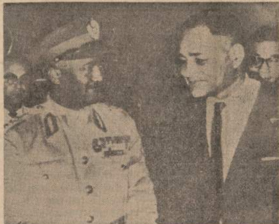
Dr. Ralph Bunche (dešinėje), Jungtinių Tautų pusekretorius, kalbasi su J. T. karo jėgų vadu, Indijos generolu Kebede Guebro Leopoldvillej, Kongo.

Daugiausia iš Pravdos teko komunistinei Kinijai už jos "savižudybės filosofiją", tai yra, už kurtymą sukelti atominį karą, už Amerikos vadinimą popieriniu tigrū ir priekaištus dėl atsisitraukimo iš Kubos. Kritikai, kurie smerkia Sovietus už raketų išgabėtimą iš Kubos, nežino, ką kalba, rašo Pravda.