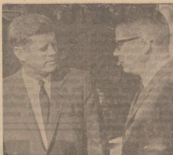
Zemės ūkio sekretorius Orville Freeman (dešinėje) kalbasi su prezidentu Kennedžiu prie laikino „baltojo namo“, Palm Beach, Fla.