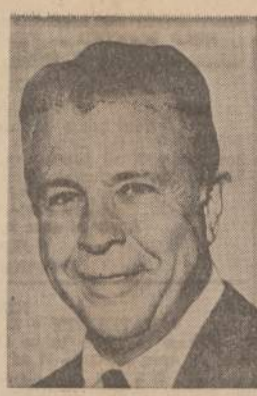
Aktorius Dick Powell (kairėje) ir aktorius - komikas Jack Carson, tą pačią dieną (trečiadienį) mirė nuo vėžio ligos.