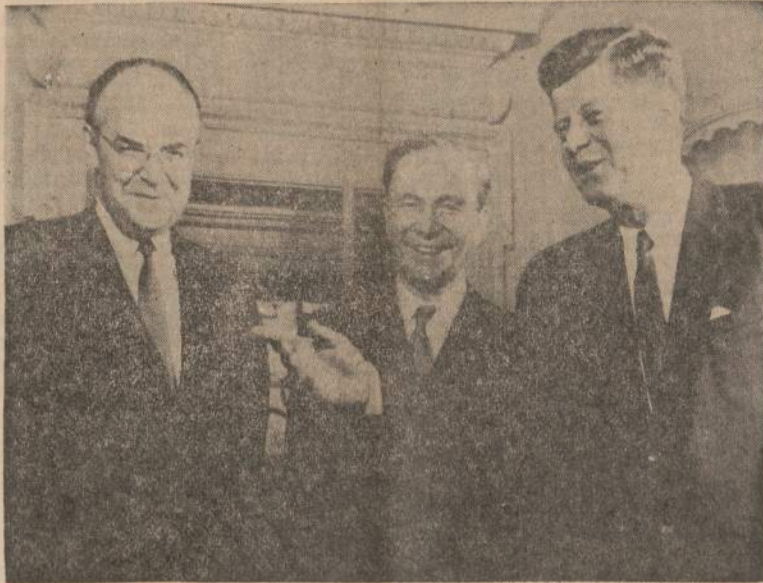
Prezidentas Kennedy ir Sovietų įgaliotinis Kubos deryboms, Vasil Kuznetsov (viduryje) Washingtonė tarėsi dėl nebaigto Kubos klausimo ir kitų "šaltojo karo" problemų.