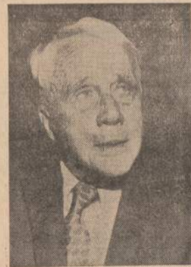
Robert Frost, kuris keturis kartus laimėjo Pulitzer skiriamą premiją ir buvo laikomas Amerikos poetu-lauratu, mirė Bostono ligoninėje, sulaukęs 88 metus amžiaus.

— Trys angliakasiai žuvo, kilus gaisrui Freeman Coal Mine kompanijos kasykloj prie Logano miesto, Ill.