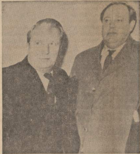
Britų užsienio reikalų viceministeris Edward Heath (kairėje) ir žemės ūkio ministeris Christopher Soames išeina iš Belgijos užsienio reikalų ministerio Paul Henri Spaak kabineto, Briuselyje, po to, kai Prancūzija pastoja kelią Anglijai tapti Europos bendros rinkos nariu.

Kai atėjo leidimas iš Kennedžio naudoti aviaciją, kubiečiai jau nebeturėjo lėktuvų. Išskyrus du, buvo numušti. Išsikėlusieji į krantą kovotojai greit išbaigė šaudmenis, nes Castro lėktuvai paskandino transporto laivus. Praėjus dviem dienom, Fidel Castro paskelbė, kad invazija, kad ir remiant Amerikai, buvo sutriuškinta.