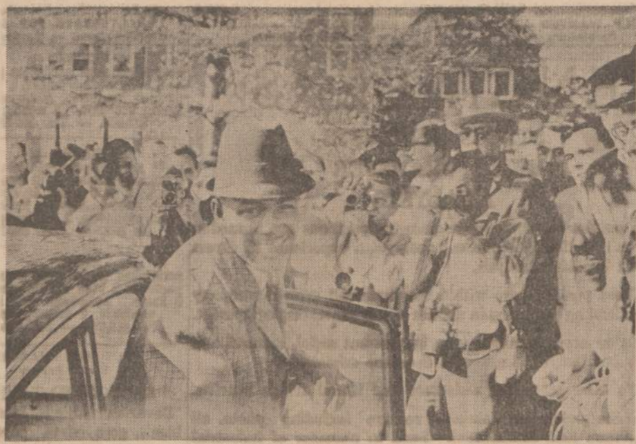
Harvey Gantt, pirmas neegras, priimtas į Clemson kolegiją (Clemson, S. Carolina), šypsosi spaudos atstovų apsuptyje.

WHY? ... ONLY YOU CAN PREVENT FOREST FIRES!