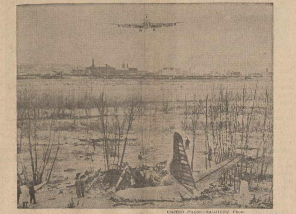
Sprausminis lėktuvas artinasi prie Kansas City (Mo.) aerodromo. Lėktuvas nepajėgė sustoti, išvertė aerodromo tvora ir atsitrėnkė į upės pylimą. Aštuoni žmonės žuvo.