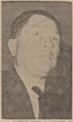
Soferių unijos prezidentas James Hoffa padarė viešą kaltinimą, kad apdraudęs kompanijos atsikako jo vadovaujamos unijos fondus apdrausti, nes generalinis prokuroras Robert Kennedy "į jas daręs spaudimą". Tačiau kongreso švietimo ir darbo komiteto posėdyje Hoffa atsikako po priesaiką tą kaltinimą pakartoti.