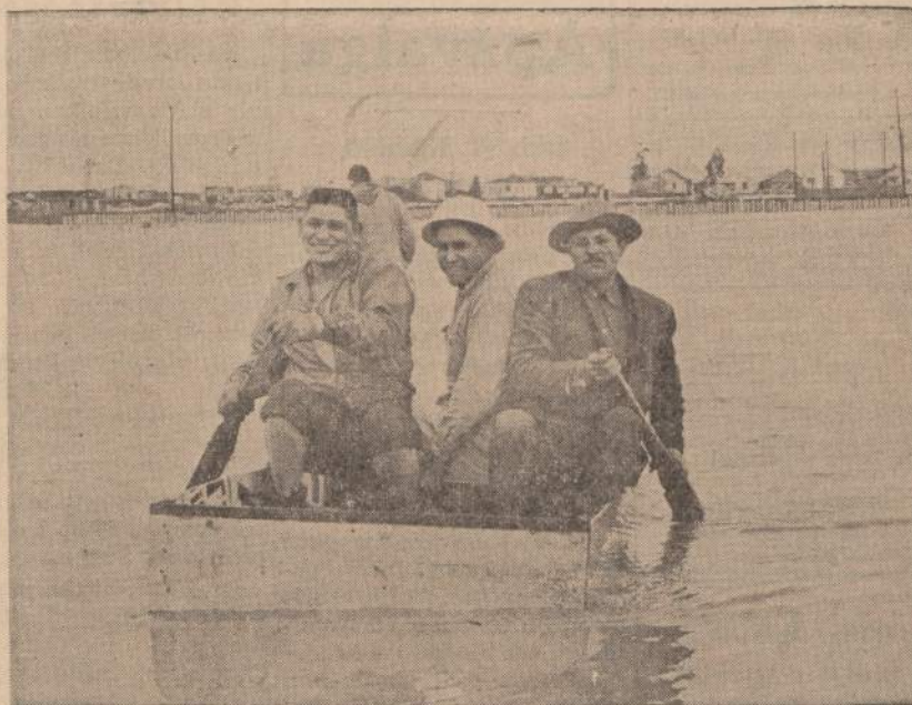
Alviso (Calif.) po didelės liūtės virto tikru ežeru. Apie 200 žeimų turėjo aplaisti savo namus.

Bet kongrese Lietuviškųjų Parapijų sekcijos pranešėjai šio, net eiliniam lietuviui žinomo, reikalo nuodugnai ir plačiai neušvietė. Net nesuskaitė, nors tik Čikagoje, parapijų mokyklas lankančius lietuvius vaikus. Jie daugiau kaltino naujuosius ateivius, kad per mažai dalyvau-