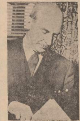
Douglas Harkness, Kanados gynybos ministeris atsistatydino, protestuodamas prieš premjero Diefenbakerio politiką.

Australijos, Kanados ir Naujosios Zelandijos atstovybės pagedauja amatininkų, nagingų žmonių, nes paprastų darbininkų ir patys turi pakankamai. Ypač viliojami britai su aukštu mokslu — gydytojai, chemikai, inžinieriai.