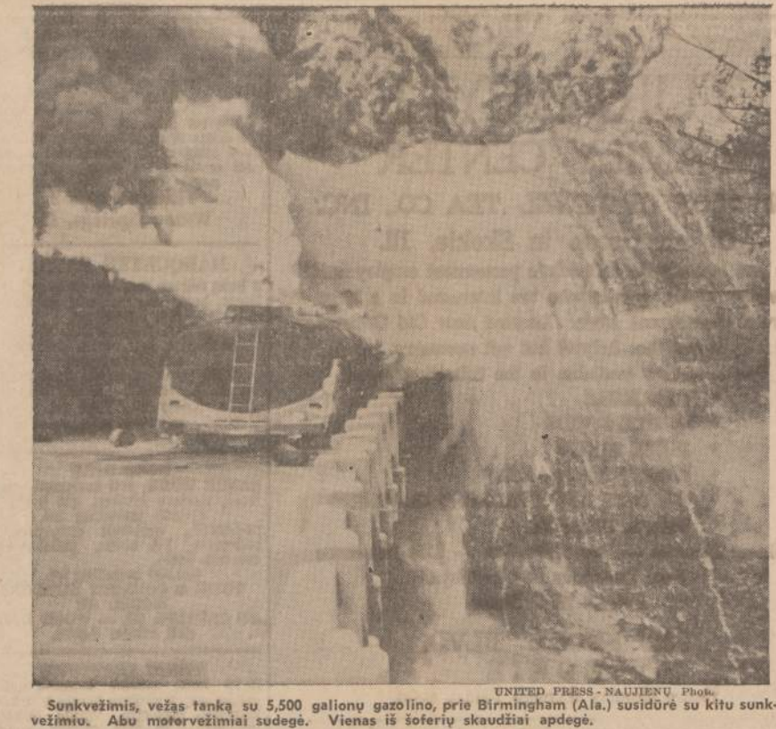
Sunkvežimis, vežas tanką su 5,500 galionų gazolino, prie Birmingham (Ala.) susidūrė su kitu sunkvežimiu. Abu motorvežimiai sudėgė. Vienas iš žoferių skaudžiai apdegė.