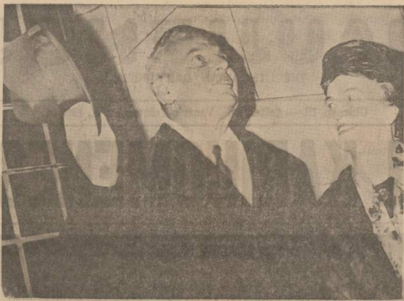
Kanados premjeras John Diefenbaker, po paršikimo jo vadovaujamai vyriausybei nepasitikėmo 142 balsais prieš 111, kartu su žmona apleidžia parlamento rūmus, mosikuodamas galerijoje susirinkusiai publikai.