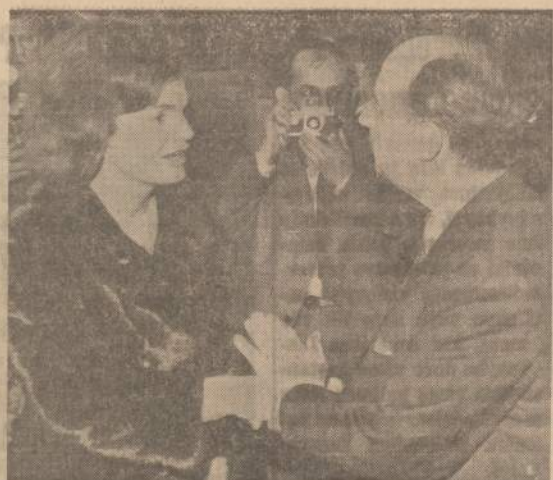
Amerikos ambasadorius Jungtinėms Tautoms Adlai Stevenson atsisveikina su Prezidento žmona, Jacqueline, J. T. Bustinie, New Yorke.

Prieš 15 ar 14 metų atvykę į Ameriką mes radome čia mūsų senosios išėvijios sukurtą garbingų organizacijų, kurios dar