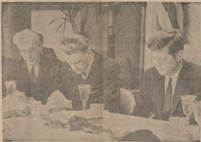
Prezidentas Kennedy (dešinėje) dalyvauja tarptautinės krikščionių vadovybės "prezidentiniuose" maldos pusryčiuose" Mayflower viešbutyje, Washingtono.

LONDONAS. — Ketvirtadienį anglų darbo partijos parlamento nariai balsavo iš naujo dėl vado, kuris užims mirusio Hugh Gaitskell vietą ir būtų ministru pirmininku, jei partija laimėtų ateinančius rinkimus. Pirmuosiuose balsavimuose radikališkas salioninis socialistas, Oxfordo auklėtinis Harold Wilson gavo 115 balsų, savamokslis, buvęs sunkvežimio šoferis, unijos vadas ir dešiniojo sparno atstovas George Brown — 88 balsus. Ateinančiuose balsavimuose trečiasis kandidatas James Callaghan, gavęs 41 balsą, nebedalyvaus. Manoma, kad jo šalininkai atiduos savo balsus Brownui.