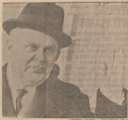
Kanados premjeras John Diefenbaker mosikuoja laikraštiniams, aplėsdamas savo oficialią rezidenciją.

Ta pati istorija dabar kartojasi Irake. Tai Maskvos "reali politika".