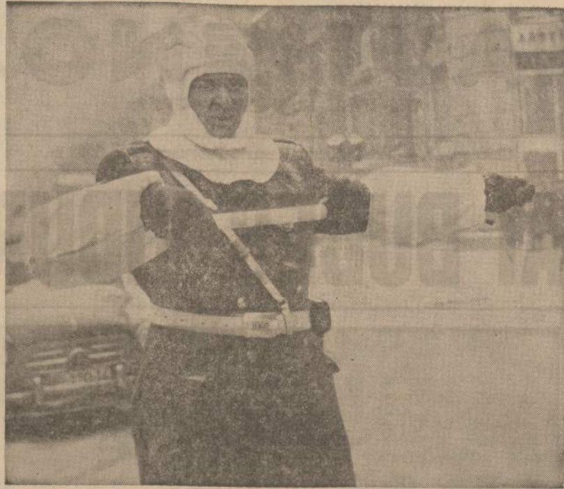
Belgrado, Jugoslavijos sostinės, eismo policininkai dėl dėvimų drabužių atrodė lyg kokie iš Marso atklydę robotai. Vaikai juos ir vadina "marsiečiais".

Kaip jau minėjau, vakare dalyvavo per 200 žmonių. Tas skaičius būtų buvęs didesnis, jei ne šalčiai bei dėl jų pradėjusios siausti ligos. Žvalgas