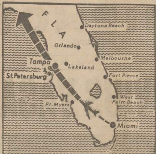
Federalinė orinio susisiekimo agentūra tiria, kur ir kodėl nukrito Northwestern linijos srausminis lėktuvas su 43 žmonėmis, vos pakilęs iš Miami, Fla., kelionei į Chicago.