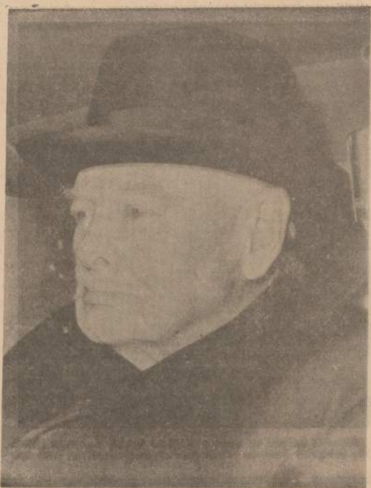
Sir Winston Churchill grįžta iš pasivaikščiojimo po Londoną.

Antrojo Pasaulinio karo metu ir per keletą metų