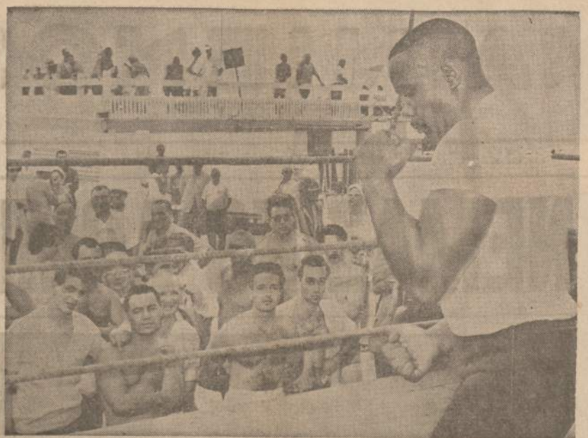
Sonny Liston, pasaulio sunkiojo svorio čempionas-boksininkas, pradėjo treniruotis Miami Beach (Fla.) viešbutyje. Balandžio pradžioje jis vėl rūsins su Floyd Patterson, iš kurio pernai laimėjo čempionatą nokautu pirmame runde.