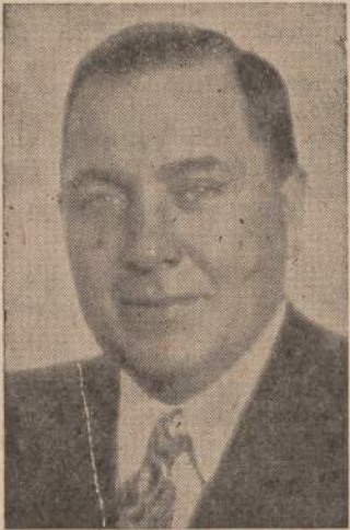
Meras Richard J. Daley