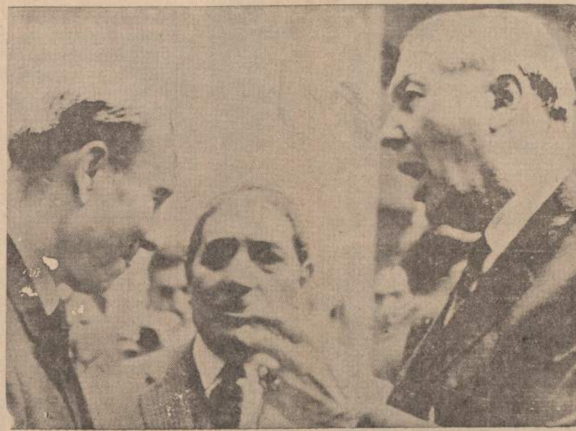
JAV delegatas William G. Foster (dešinėje) kalbasi su Sovietų delegatu Vasilij Kuznecov (kairėje) ir pirmininku L. Nervo (Meksikos delegatu) Pasaulio nusiginklavimo konferencijoje, kuri vyksta Zenevoje, Šveicarijoje.

Kaip sovietų Rusijoje spekuliuoja, bent keletas pavyzdžių.