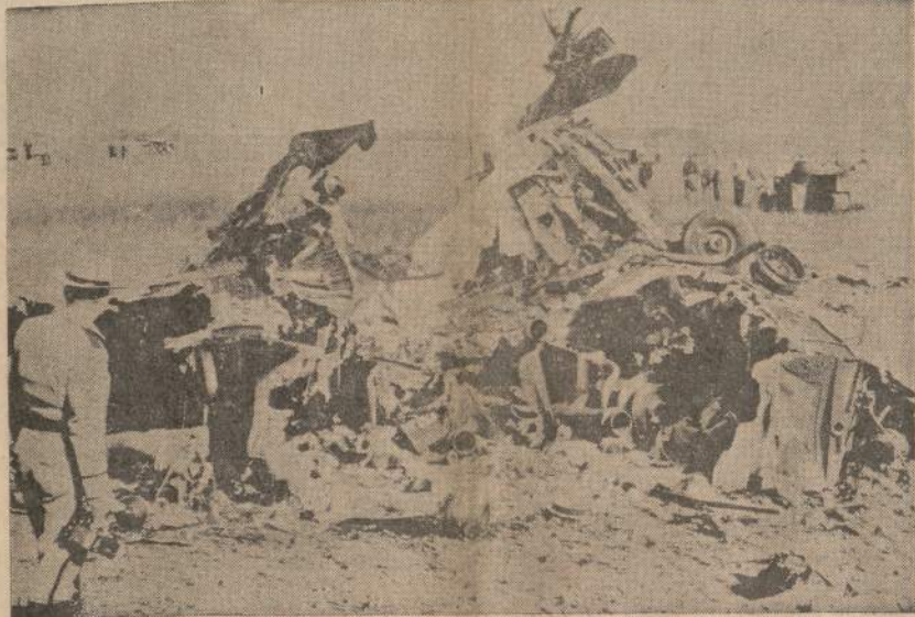
Floridos milicininkas prie sudužusio sprausminio lėktuvo, kuris nukrito apie 40 mylių nuo Miami. Žuvo visi keleiviai ir aštuoni lėktuvo įgulos nariai, iš viso 43.

Jakarta Indonezijos užsienio reikalų ministeris Subandrio pasakė, kad jo šalis teiks pilną paramą šiaurės Borneo salos gyventojams, nenorintiems britų dominuojamos Malajos federacijos. "Fizinis konfliktas" su Malaja bus neišvengiamas, jei