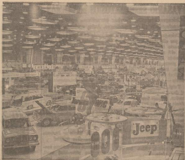
Automobilių paroda, vykstanti McCormick Place patalpose, Chicagoje.

Po posėdžio ir iškilmingo Lietuvos nepriklausomybės atž-