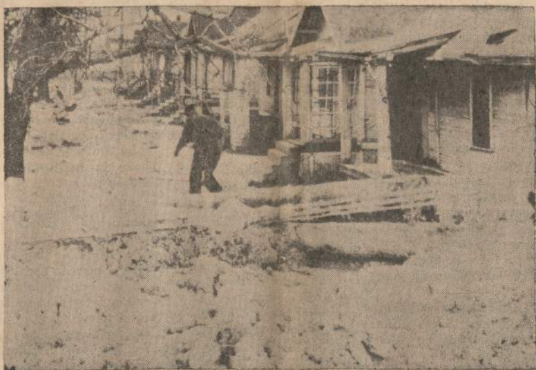
Kai 75 pėdų aukštumo tankeris susmuko, tai iš jo išsiveržė į lavą panašus dumblas (acetileno dujų priedinis produktas) ir užliejo visą eilį namų Louisville (Ky.) mieste.

— Graikų tanklaisvis Electra ketvirtadienį nuskendo Atlante ties Prancūzijos pakraščiais. Žuvo trys jūrininkai.