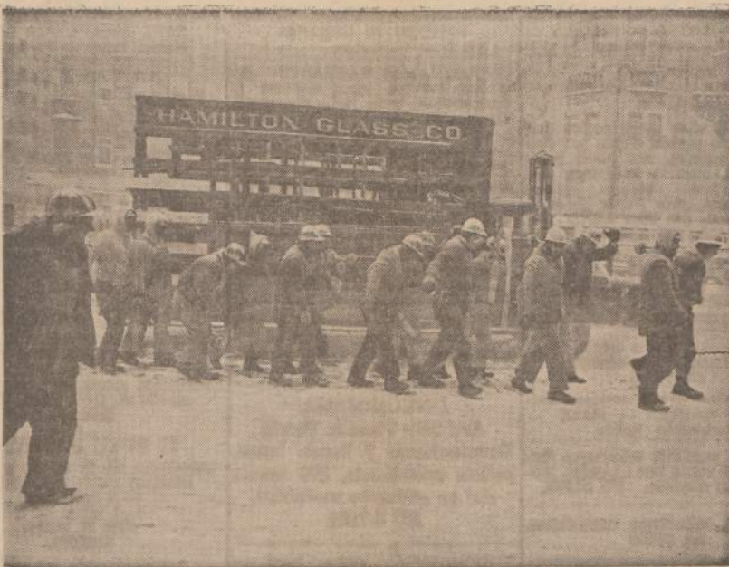
Chicago stiklai neša 700 svary stiklą naujam pastatui. Stiklo ilgumas 249 coliai, plotis — 60 colių ir storumas — pusė colio.

Paskutinis toje serijoje žuvo Clem Graver, trečias valstybės atstovas (state rep.).