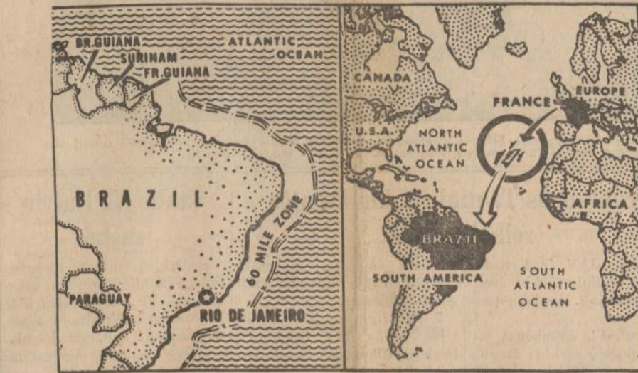
Zemėlapis parodo 60 mylių vandens zoną, dėl kurios tarp Brazilijos ir Prancūzijos kilo "vėžių karas". Brazilijos valdžia sako, jog prancūzai toje zonoje neturi teisės vėžius gaudyti. Prancūzai gi yra priešingos nuomonės ir, kaip skelbiama, savo teisems apginti siūncia karo laivus.

BONA. — Vokietijos senatas rafitikavo draugystės ir bendradarbiavimo sutartį, sudarytą sausio mėnesį Adenauerio ir De Gaulle Paryžiuje. Kancleris užtikrino, kad sutartis nebus kliūtis atlikti Vokietijai įsipareigojimams Nate ir Europos ekonominė bendruomenėj. Sutartį dar turi patvirtinti Vokietijos parlamentas.