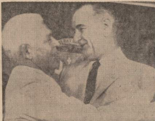
Naujai išrinktas Dominikos respublikos prezidentas Juan Bosch po iškilmingo įvesdinimo į prezidento pareigas apglėbė Amerikos viceprezidentą Lyndon Johnsoną (dešinėje), kuris atvyko į Santo Domingo kaip JAV atstovs.

Lakūnas, matyti, pateko į bėdą ir manė, kad jį ištrauks iš jūros laivo gelbėjimo komandos. Bet lėktuvas su lakūnu tuoj nugrimzdė. Jis skrido iš Portorikos į Floridą.