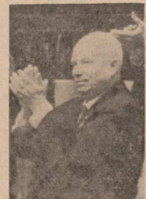
Sovietu premjeras Nikita Chruščiovas, baigęs sakyti kalbą, pagal boise-vikišką paprotį pats sau ploja.