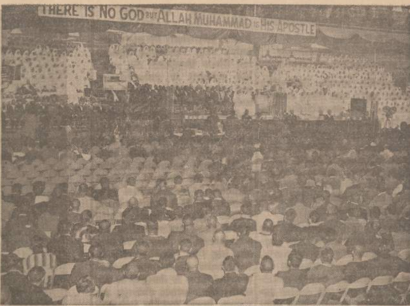
Chicago Koliziejus, kur juodieji musulmai laukė, bet nesulaukė savo vado Eliaha Muhamada Poole. Vietoje jo kalbėjo mažesni vadai.

Kaip giliai įbrido tos kolchozinės bėdos bei nesėkmės, matyti dar ir iš vieno vyr. varovo nusiskundimo — kolchozuose bei sovechozuose per daug esą išplėstas administracinis valdymo personalas, tad... ar netektų jį mažinti? Tačiau Sniečkus paminėtas blogis — išpista biurokratija — būdinga visai bol-