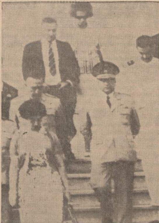
Peru respublikos ginkluotos jėgos pašalino militarines valdžios vad. Pašalintasis militarinis administracijos prezidentas generolas Ricardo Perez Godoy (viduryje) kartu su savo žmona aplėdžia valdžios rūmus, esančius Peru sostinėje, Lima.

JEI NENORI ATSIKILTI NUO PASAULIO ĮVYKIŲ — SKAITYK "NAUJENAS" — JOS TEIKIA GERIAUSIAS, TEISINGIAUSIAS ŽINIAS