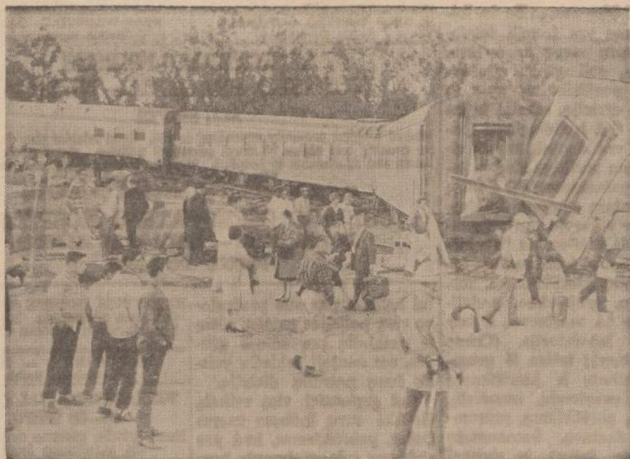
Netoli Northridge (Calif.) nuoko nuo bėgių Southern Pacific traukiny. Buvo sužeisti septyni asmenys.

SOPHIE BARCUS RADIJO SEIMOS VALANDOS Visos programos iš WOPA, 1490 kil. AM. Lietuvių kalba: kasdien nuo pirmadienio iki penktadienio 10-11 val. ryto. — Seštadienį ir sekmadienį nuo 8:30 iki 9:30 val. ryto. Vakarų šos: pirmadieniais 7 v. v. Tel.: HEMlock 4-2413 7159 SO. MAPLEWOOD AVE. CHICAGO 29, ILL.